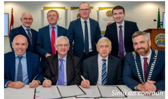
Síniú an conradh