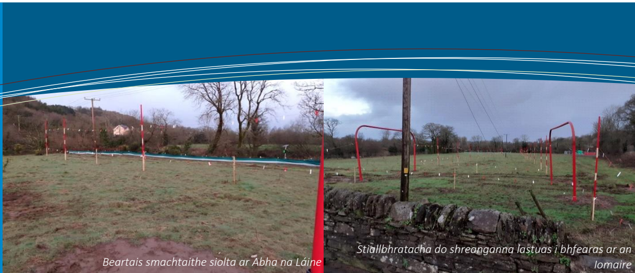
Beartais smachtaithe siolta ar Abha na Láine

Oifigí Láithreáin N22 BBM, Bóthar Shráid an Mhuilinn, Maigh Chromtha, P12 PN24