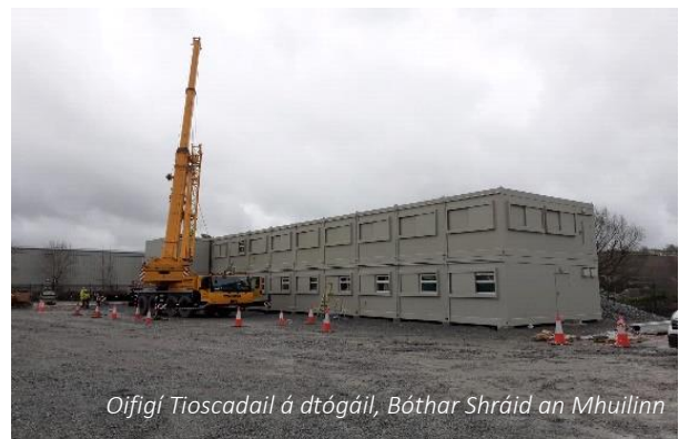
Oifigí Tionscadail á dtógáil, Bóthar Shráid an Mhuilinn